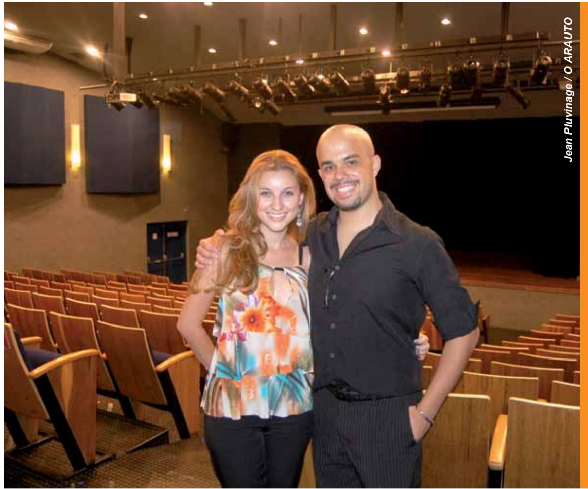
Jean Pluvinage / O ARAUTO

“Iremos buscar peças que tenham um contexto cultural, não se trata de mostrar o que está na moda.” destaca Nelson. Sua preocupação com o conteúdo teatral inclui a própria definição de cultura: “É uma palavra que tem muitos significados, tudo pode ser considerado cultura, nem que seja cultura de alface. Mas o que permite um produtor avaliar bem a qualidade de uma peça é a sua formação em teatro, ter referências. O produtor tem que amar a arte que gerencia.” Com sua experiência em gestão empresarial ele busca também a formação de um forte mercado cultural em Indaiatuba e região, “O retorno do marketing cultural é muito mais forte do que expor um logo em um panfleto. A empresa que apoia o teatro fica associada a um momento de prazer e cultura.” explica.